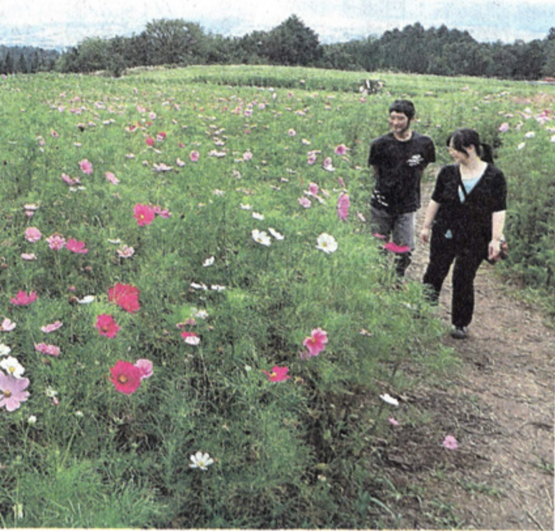
畑に咲き始めたコスモス

かに揺れている。花でもてなす観光喜多方推進事業の一環として市が五月の菜の花、夏のヒマワリに続けて整備した。約一・六畝の畑に約百万本のコスモスの種を六月中旬にまいて育ててきた。